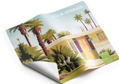
Ansicht des fertigen GripCleaner®

• Wir empfehlen diese Angabe aufgrund der Textilkennzeichnungsverordnung.